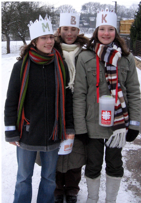
Jedna z našich skupinek